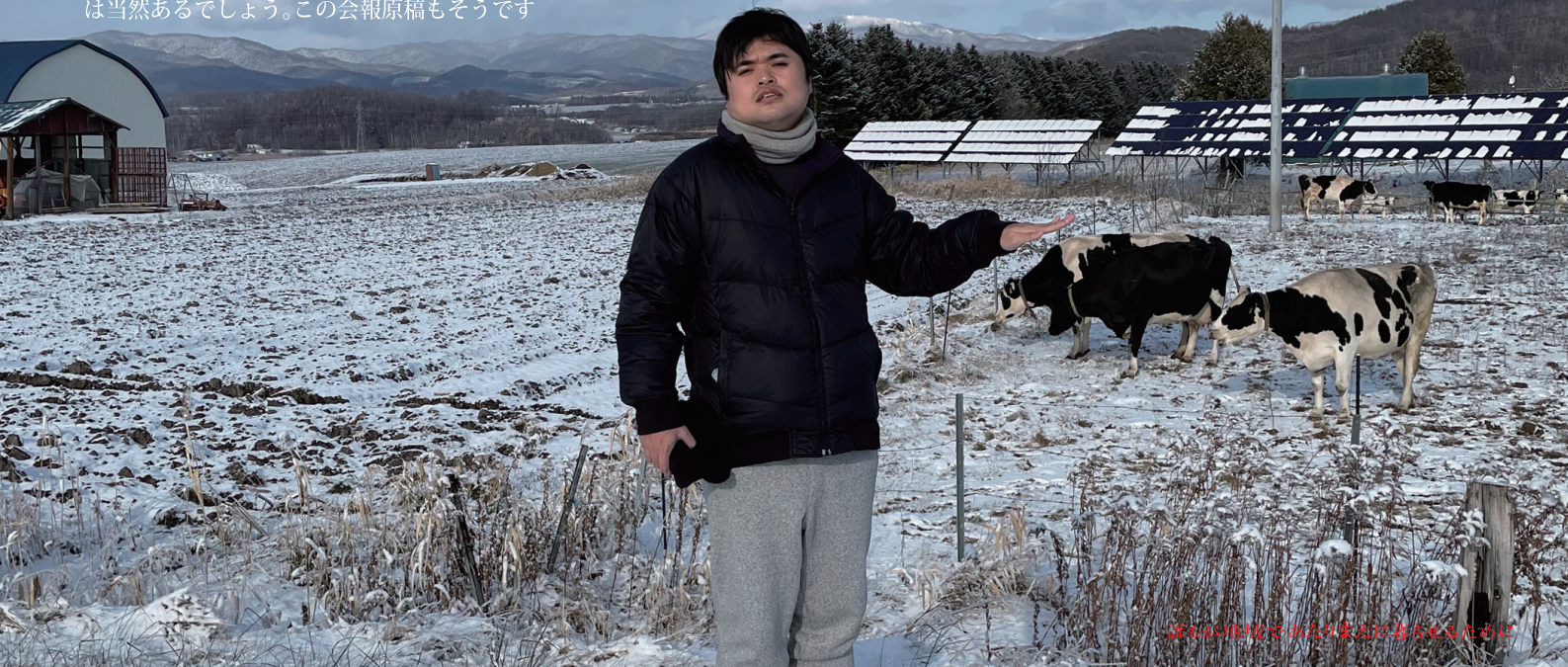
雪からの除雪がかなり楽になったからと