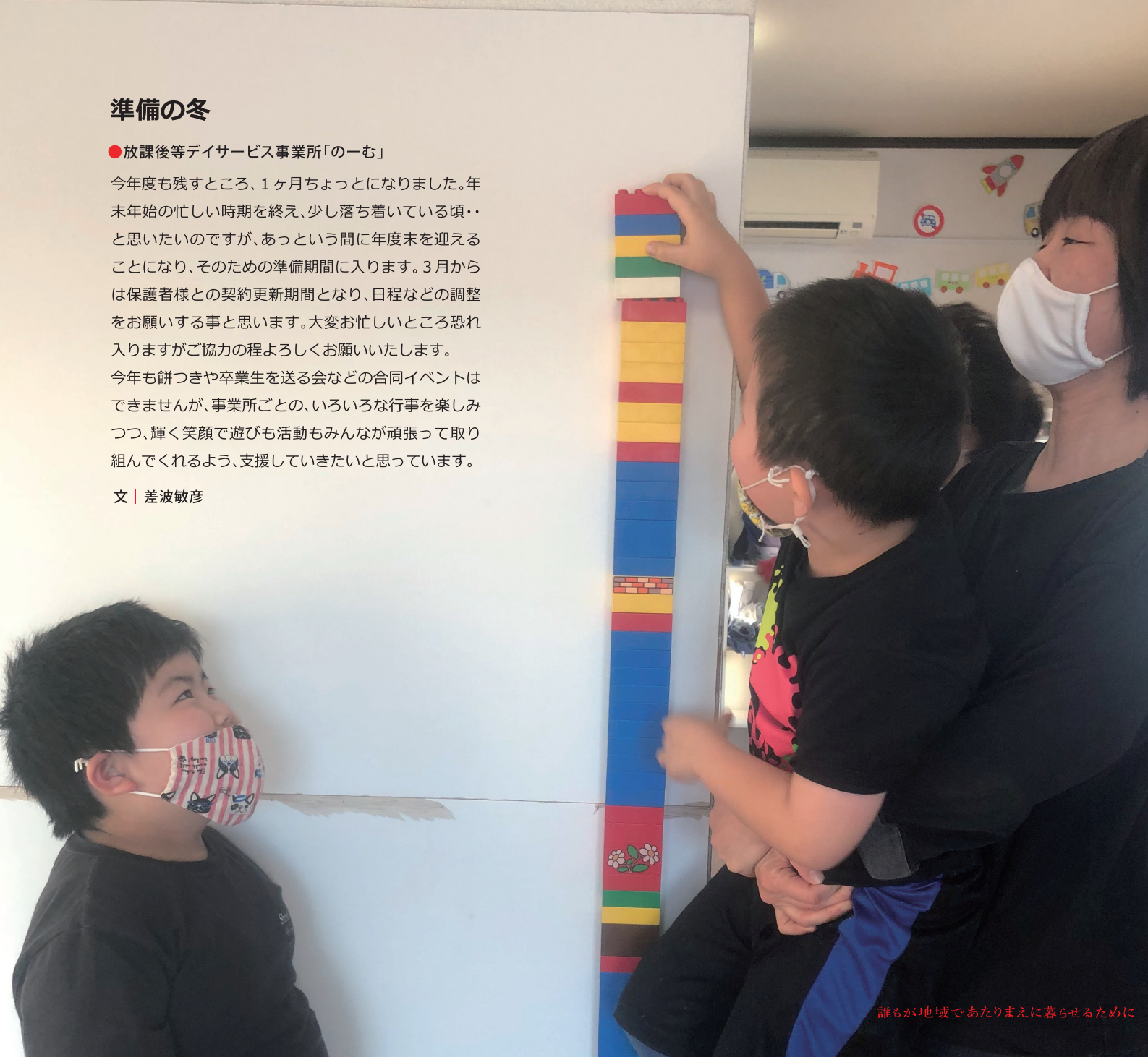
誰もが地域であたりまえに暮らせるために