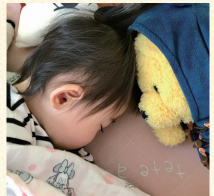
以上、娘ののろけ話でしたー(笑)