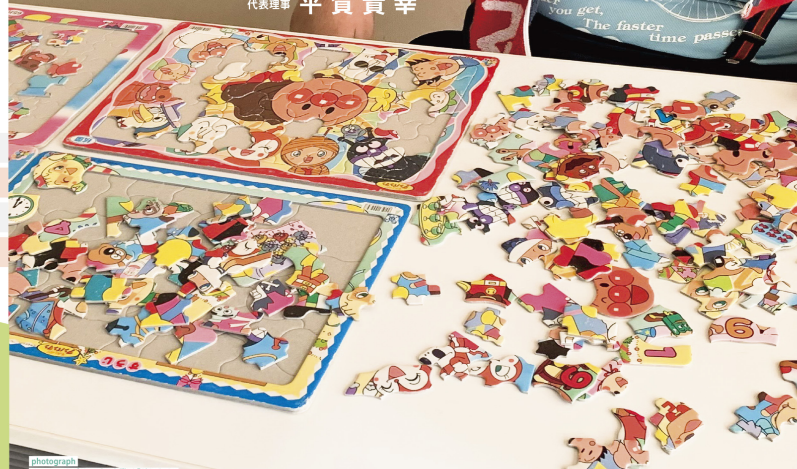
photograph ホームヘルプサービス事業所「どんぐり」 4枚のジグソーパズルに一度に挑戦